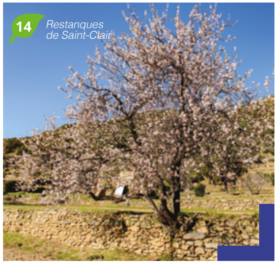
14 Restanques de Saint-Clair