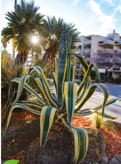
5 Rond-point de Kronberg