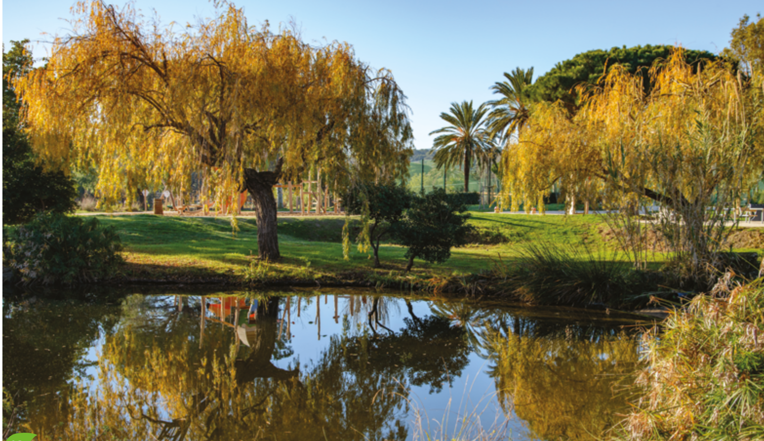
13 Parc du Grand Jardin