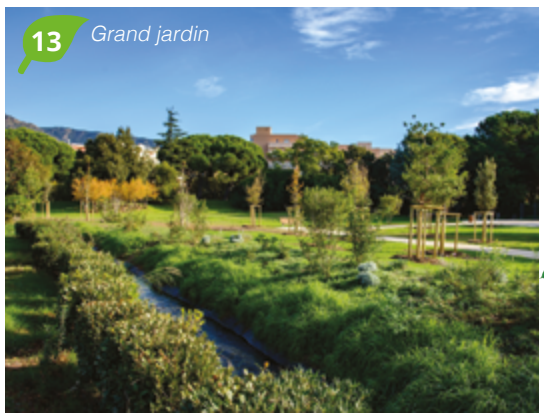
13 Grand jardin