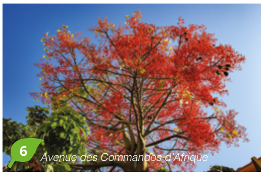
6 Avenue des Commandos d'Afrique