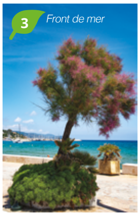
3 Front de mer