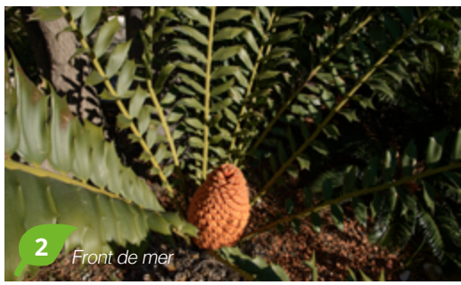
2 Front de mer