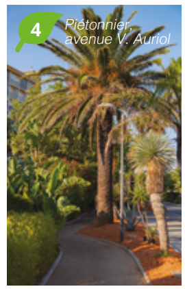
4 Piétonnier, avenue V. Aurioi