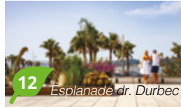
12 Esplanade dr. Durbec