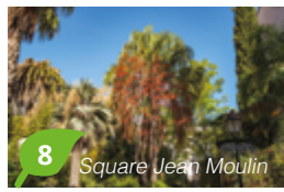
8 Square Jean Moulin