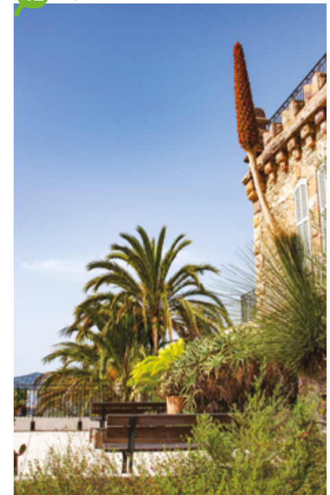
12 Esplanade du docteur Durbec