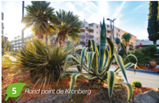
5 Rond point de Kronberg